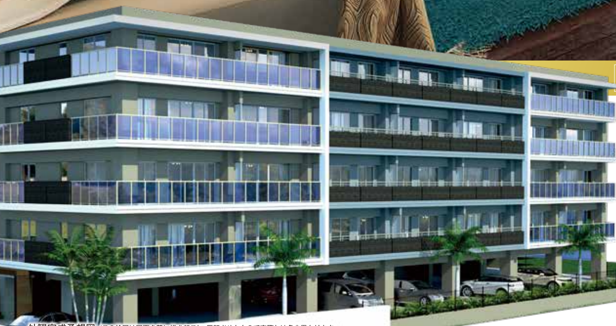
外観完成予想図 / この絵図は図面に描き起こし、反転させたもので実際とは多少異なります。

リビング・ダイニング完成予想図(Aタイプ) / この絵図は図面に描き起こした完成予想図に、眺望写真をCG処理して合成したもので、実際とは多少異なります。